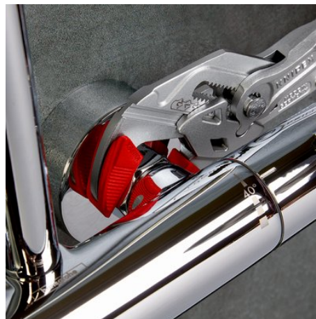
munkavégzés krómozott szerelvényen a felület megrongálása nélkül